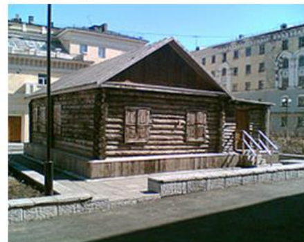
Первый дом Норильска